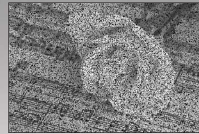
普通超低照度攝像機效果